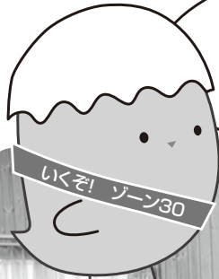
ふたこたまご ちゃん

6月15日(土) 二子玉川小学校ラ ンチルームで、第1回二子玉川安全 安心ゾーン検討ワークショップを開 催しました！！