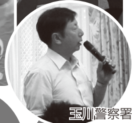
玉川警察署から 情報提供