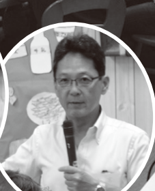
二子玉川小学校 小宮校長先生ご あいさつ