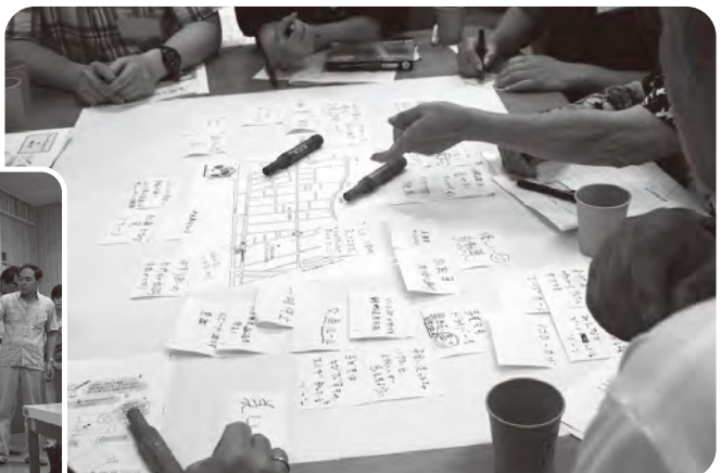
「こんなゾーンになったらいいな」をテーマに 参加者全員でグループワーク