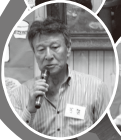
芳賀町会長 ごあいさつ