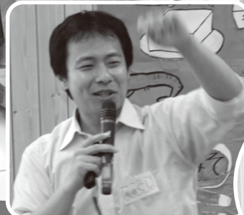
成蹊大学稲垣先 生から情報提供