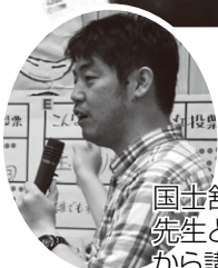
国士舘大学寺内 先生と稲垣先生 から講評