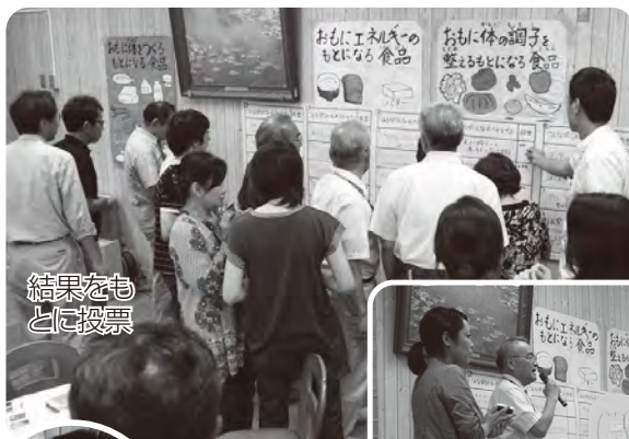
結果をも とに投票