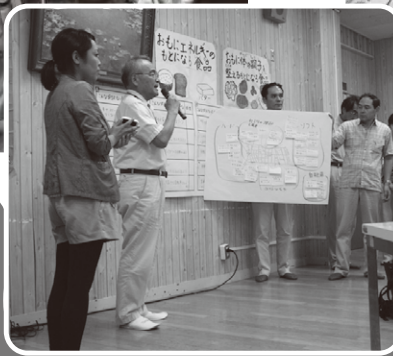
グループの検討結果を発表