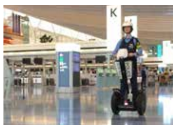
空の玄関の羽田空港では警察官が施設内のほか、立体駐車場などの安全見守りにも使っています。