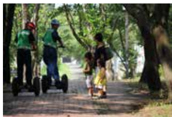
つくば市では、周辺に住む子ども達と見守りをする防犯サポーターの間で自然に挨拶が交わされています。

セグウェイは、まちの子ども達の安全見守りや施設の安全のためのパトロールでも利用されています。