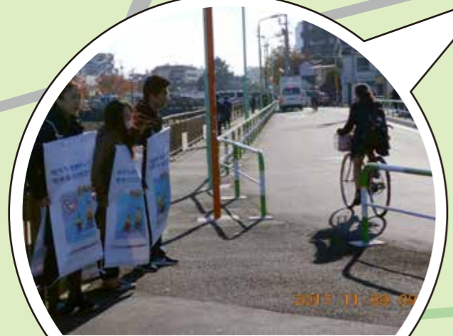
クルマの人にも(気づいてもらえて)見てもらうことができた