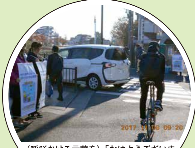
(呼びかける言葉を)「おはようございます」としたら、お返事が返ってくる人が多くモチベーションがアップした