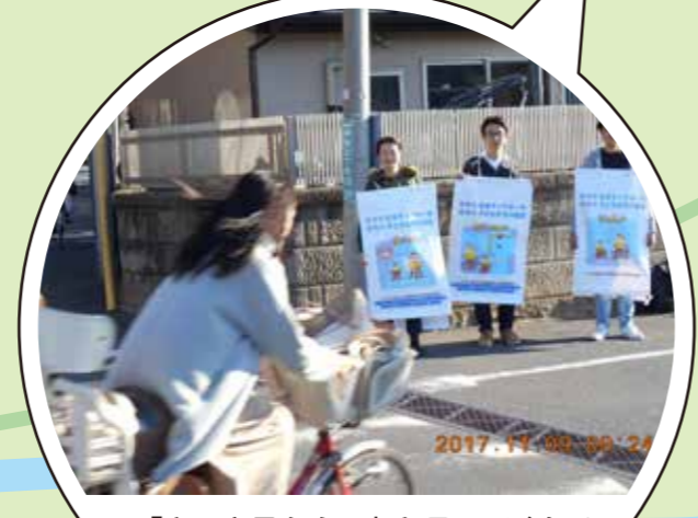
「さっき見たよ!」と言ってくれる人がいた! 同時多発の効果があったかも?