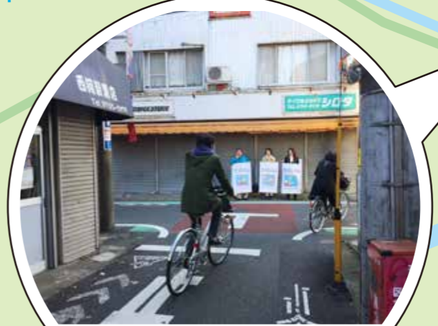
大きなPR幕をすることで、視覚でアピールできた