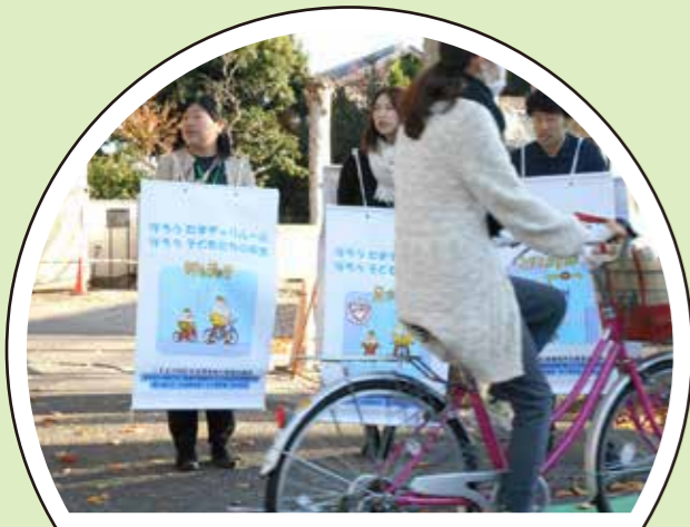
登校する喜多見小の子供たちが「たまチャリルール」に興味を持ってくれた