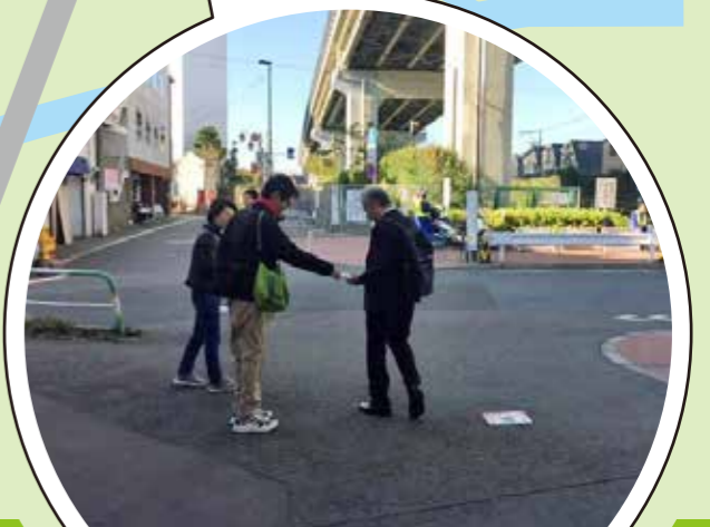
最後は、駐輪場前でキャンペーンの事を書いたティッシュを配布!