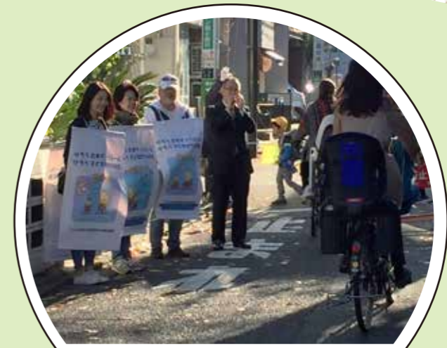
自転車と歩行者が安全に共存できる環境になると良いな