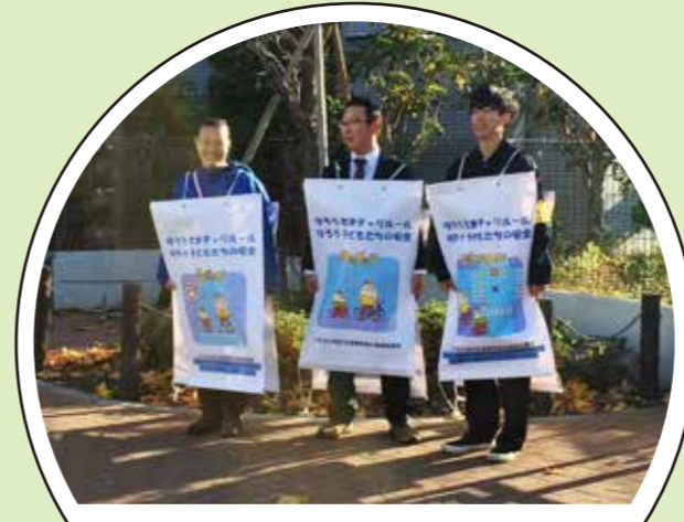
学生に向けてもアピールできる場所よかった